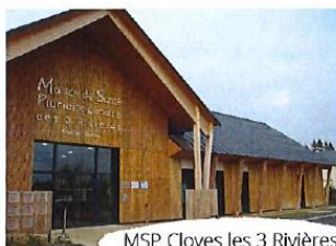
MSP Cloyes les 3 Rivières